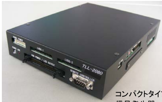
コンパクトタイプ 信号発生器 (TLL-2080)